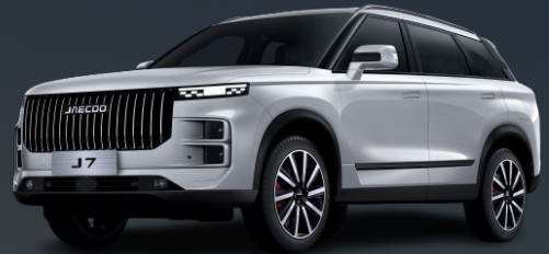
PEARL bijela 500 €