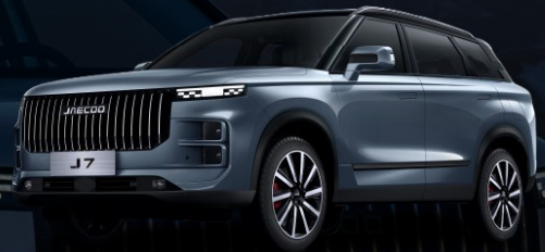
OLIVE siva + crni krov 800 €