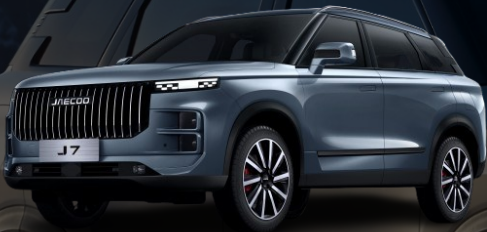
OLIVE siva 0 €