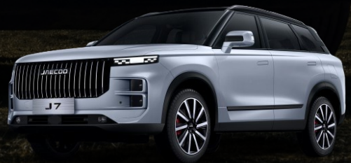
MOONLIGHT srebrna + crni krov 800 €