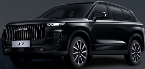
CARBON CRYSTAL crna 500 €